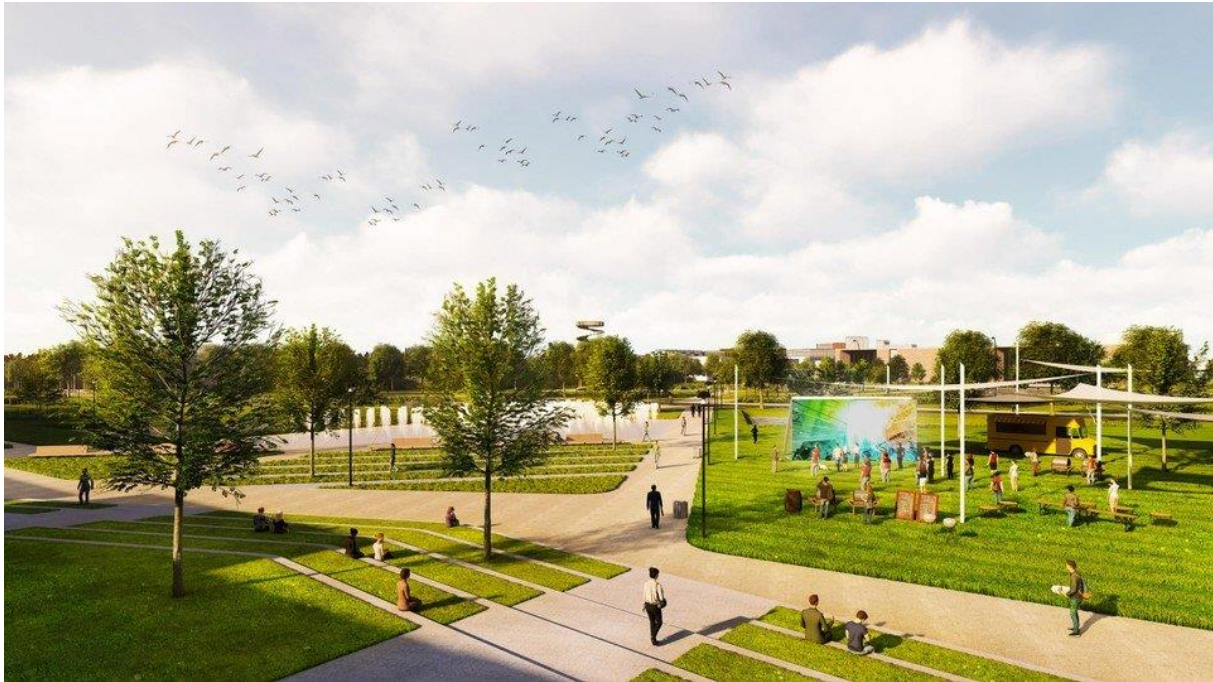
De grote parking wordt omgevormd tot een groene open ruimte.

De campus zet dus sterk in op extra beleving voor bewoners en omwonenden. “Doorheen de campus zullen er verschillende ontmoetingsplekken worden gecreëerd. Van groene rustplekjes tot horeca en sportfaciliteiten. Kortom een campus naar Amerikaans model. Op die manier stimuleren we de kruisbestuiving tussen het onderwijs en het bedrijfsleven, en investeren we onrechtstreeks in community-vorming ”, aldus Vandeput.