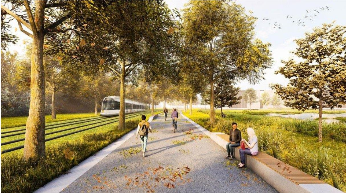
De Campusboulevard voorziet ruimte voor de Spartacustram en wandelaars en fietsers