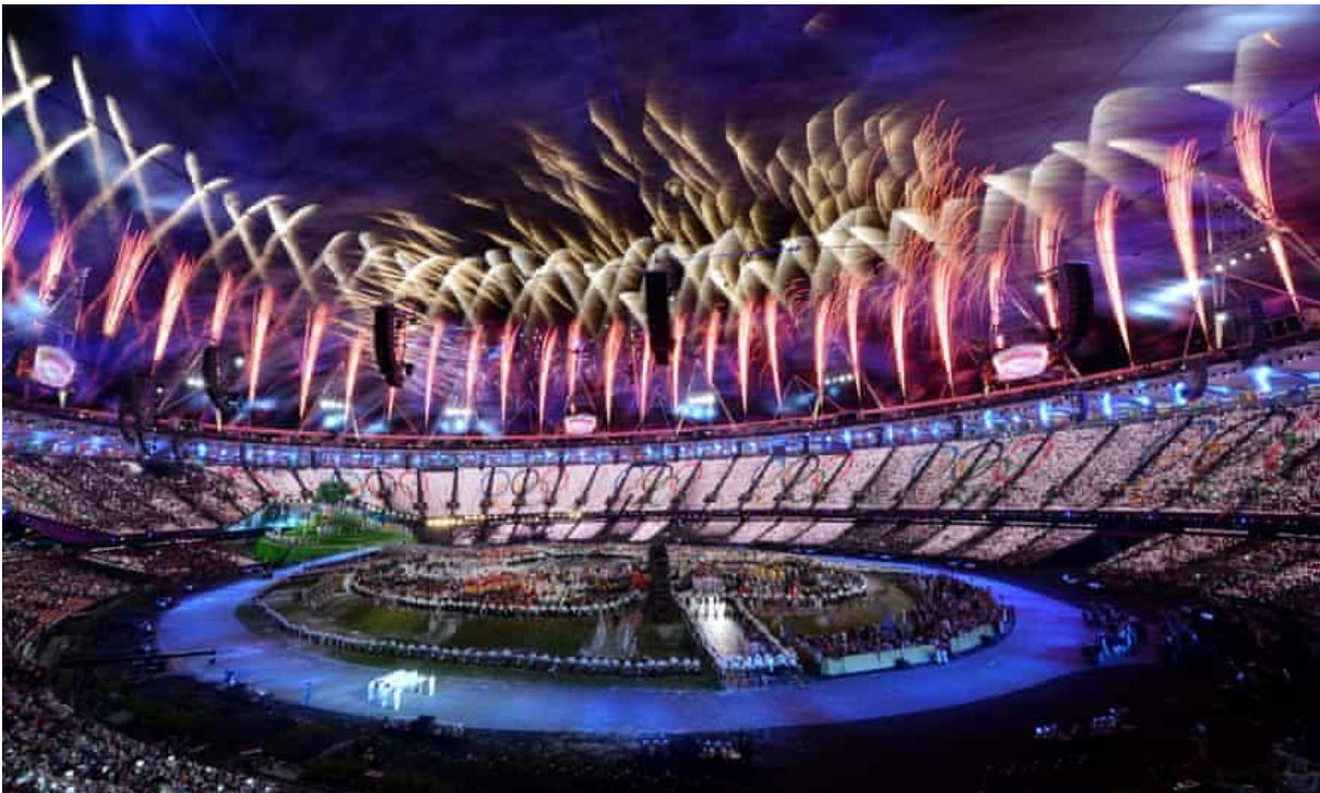
Openingsceremonie Olympische Spelen Londen 2012