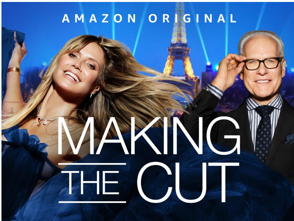
Heidi Klum en Tim Gunn