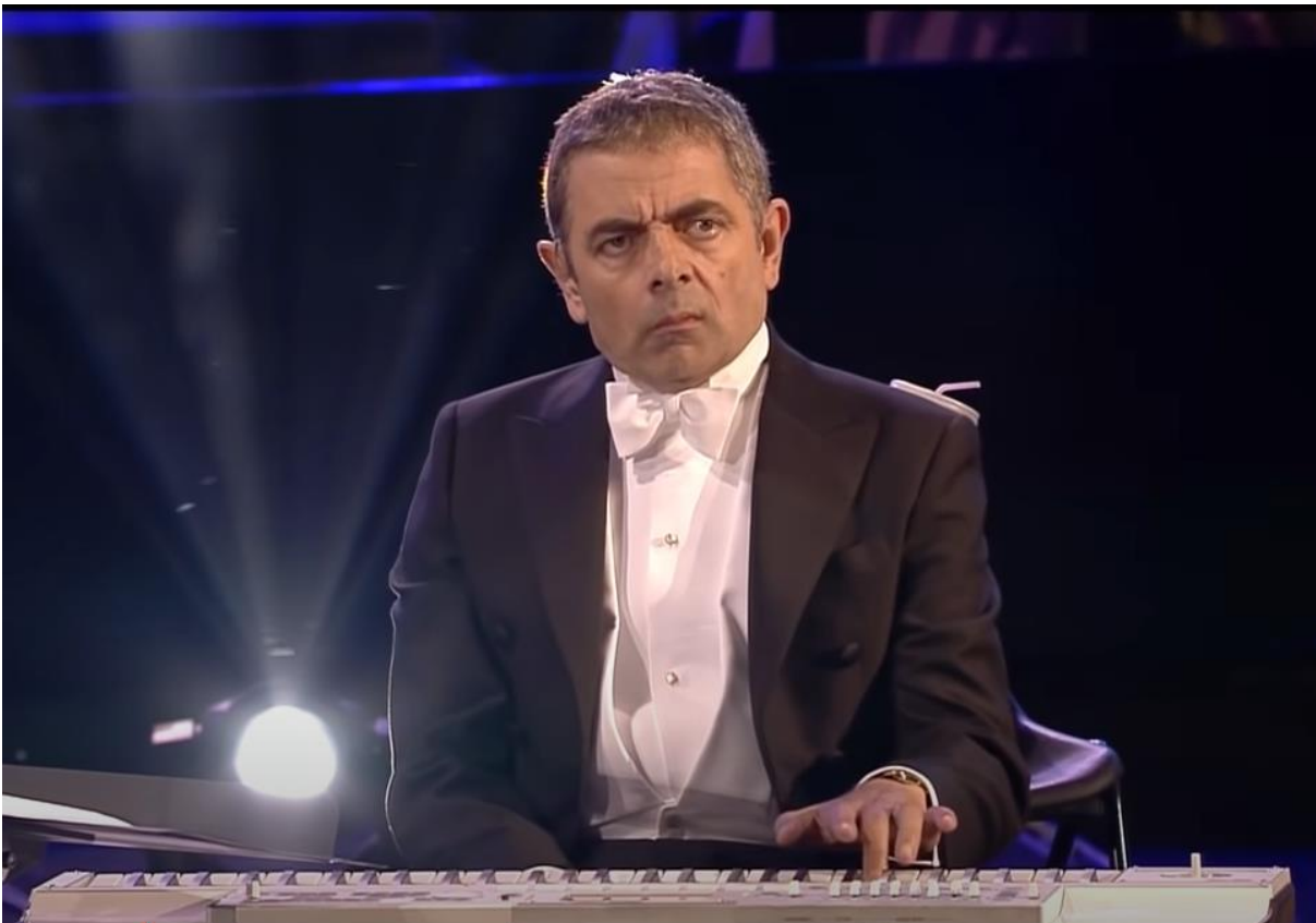
Mr Bean op de openingsceremonie van de Olympische Spelen Londen 2012

bijna onmogelijk zou zijn om alles geheim te houden tot de avond zelf. Toch is het hem gelukt. Niet door gsm's te confisqueren en zwijgcontracten op te leggen. Nee, zo zit Boyle niet in elkaar. 'Let's just ask nicely' was zijn uitgangspunt. Sebastian Coe stelde voor om het concept niet als een geheim maar als een te bewaren verrassing te benoemen. Goed idee, vond Boyle. Maar hij was niet naïef. Uit de 15.000 aanvragen liet hij experts 5000 mensen filteren die waarschijnlijk zouden opscheppen over hun deelname. Hij luisterde naar de ideeën van de uitgekozen deelnemers en technici en sloeg op tafel tot de boekhouders instemden om de deelnemers hun kostuum te laten houden, de enige betaling voor hun harde, geheime werk. Dat hij zelf niet betaald werd, hielp. Ten slotte was hij ook voorzichtig. Het indrukwekkende Olympische-vlamkunstwerk werd pas vlak voor de opening geïnstalleerd, als er al een no-flyzone over het stadion was ingesteld, en de meest gedetailleerde plannen van de hele ceremonie werden op één makkelijk te bewaken laptop bewaard.