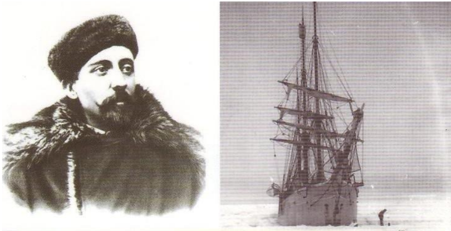
Adrien de Gerlache en de Belgica

Ontdekkingsreiziger van Antarctica (1866 - 1934)