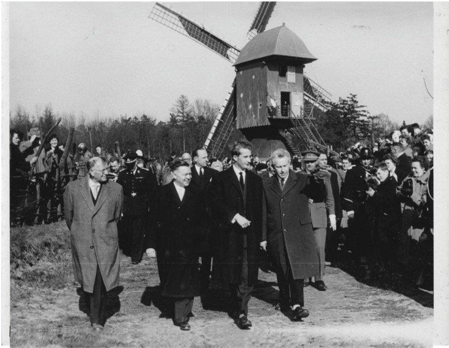
Gouverneur Roppe (tweede van links) en de toenmalige prins Albert bij de opening van openluchtmuseum Bokrijk in 1958

Gouverneur die Limburg moderniseert én Bokrijk opricht (1914 - 1982)