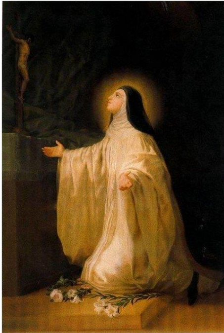
Santa Lutgarda door Francisco Goya

Invloedrijke kloosterlinge tot nu (1182 - 1246)