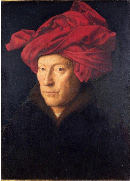
Jan van Eyck, zelfportret

kunstgenie uit de 15de eeuw (ca. 1390 - 1441)