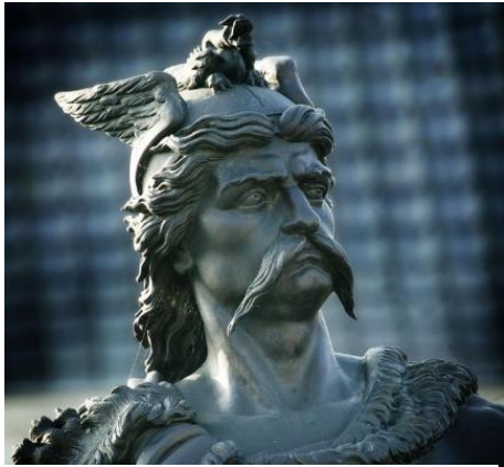
Het standbeeld van Ambiorix in Tongeren

Leider van de Eburonen (1ste eeuw voor Christus)