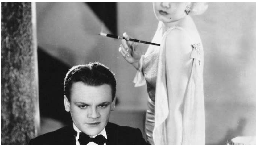
James Cagney and Jean Harlow in The Public Enemy (1931)

In datzelfde 1932 bracht Warner Brothers de film Scarface: The Shame of Nation uit, die losjes gebaseerd was op Capones opkomst als misdaadbaas. De culturele invloed van het tijdperk bleek blijvend, met gangsterfilms die populair bleven en de heldendaden van Ness leidden tot de televisieserie The Untouchables (1959-63).