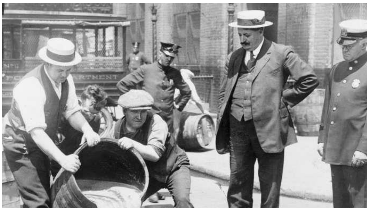
Plaatsvervangend politiecommissaris John A. Leach van New York kijkt toe hoe agenten drank in het riool gieten na een inval (1920)

Prohibition (drankverbod): het verbod op, wettelijke verhindering van de productie, verkoop en transport van alcoholische dranken in de Verenigde Staten van 1920 tot 1933 onder de voorwaarden van het Achttiende Amendement. Hoewel de Temperance Movement (matigingsbeweging), die breed werd gesteund, erin was geslaagd deze wetgeving tot stand te brengen, waren miljoenen Amerikanen bereid om illegaal sterke drank (gedistilleerde dranken) te drinken, wat aanleiding gaf tot bootlegging (de clandestiene productie en verkoop van sterke drank) en speakeasies (clandestien drankgelegenheden), die beide werden verzilverd door de georganiseerde misdaad. Als gevolg hiervan wordt het verbodstijdperk ook herinnerd als een periode van gangsterisme, gekenmerkt door concurrentie en gewelddadige veldslagen tussen criminele bendes.