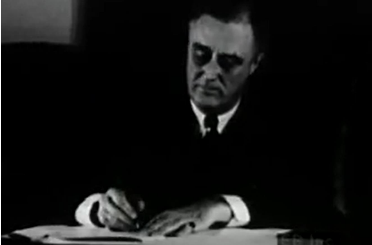
President Roosevelt ondertekent de Cullen-Harrison Act die een einde maakte aan Prohibiton`