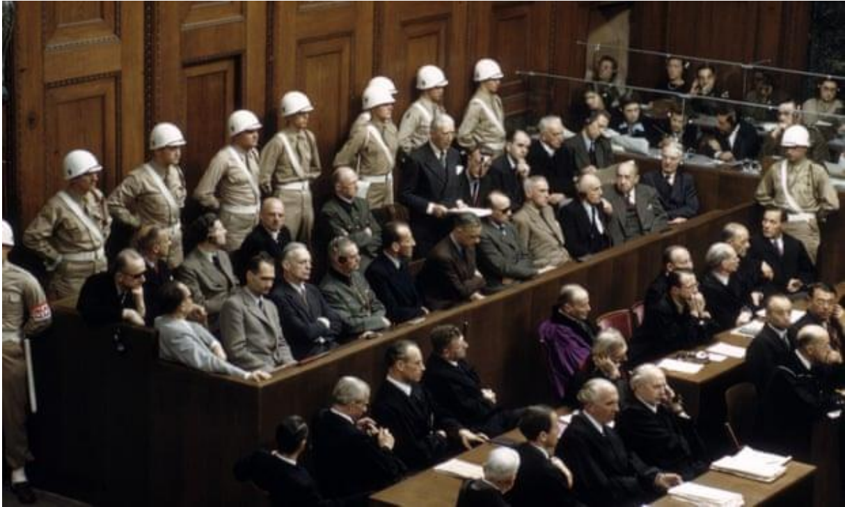
Nazi-leiders staan terecht op het proces van Neurenberg, Duitsland, dat liep van november 1945 tot oktober 1946